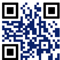
Código de Conduta do Fornecedor CAIXA

Disponível pelo link: Código de Conduta do Fornecedor CAIXA ou escaneie o QR CODE abaixo pelo celular.